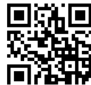
メール用 QR コード

※容量が大きいものについては、ギガファイル便等のファイル転送サービスをご利用ください